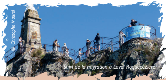
Suivi de la migration à Laval-Roquecezière