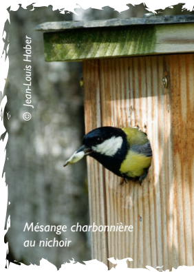
Mésange charbonnière au nichoir

Pour adhérer au programme, contactez la LPO Tarn au 05 63 73 08 38 ou par mail sur tarn@lpo.fr .