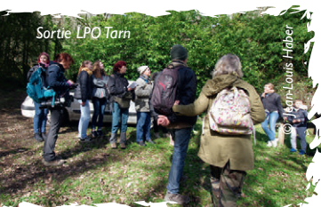
Sortie LPO Tarn