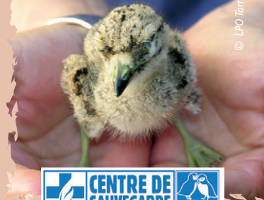
Paussin d'Oedicnème criard

La prise en charge de l'oiseau est gratuite grâce à la collaboration des cabinets vétérinaires et du transporteur.