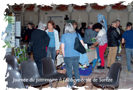
Journée du patrimoine à l'Abbaye-école de Sorèze