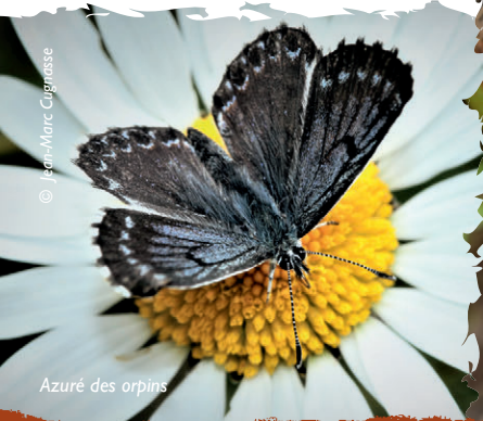
Azuré des orpins

Ne négligeons pas pour autant les plateaux environnants qui permettent l'observation du Busard Saint-Martin, du Tarier pâtre, du Bruant proyer, de l'Alouette lulu, du Pipit des arbres, de la Fauvette passerinette ou de la Pie-grièche écorcheur, pour ne citer que quelques espèces. Et si vous vous attardez jusqu'à la tombée de la nuit, le chant grave et profond du plus grand des oiseaux nocturnes vous récompensera d'une journée pleinement naturelle.