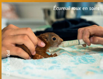
Écureuil roux en soins