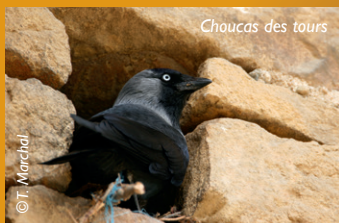
Choucas des tours

+ d'infos : http://herault.lpo.fr/centre-de-sauvegarde