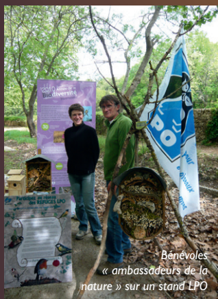
Bénévoles « ambassadeurs de la nature » sur un stand LPO