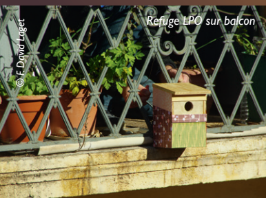
Refuge LPO sur balcon