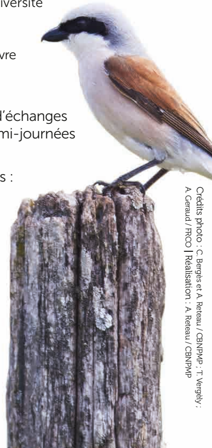
> La Pie-grièche écorcheur ( Lanius collurio ) fait un très bon auxiliaire des cultures.