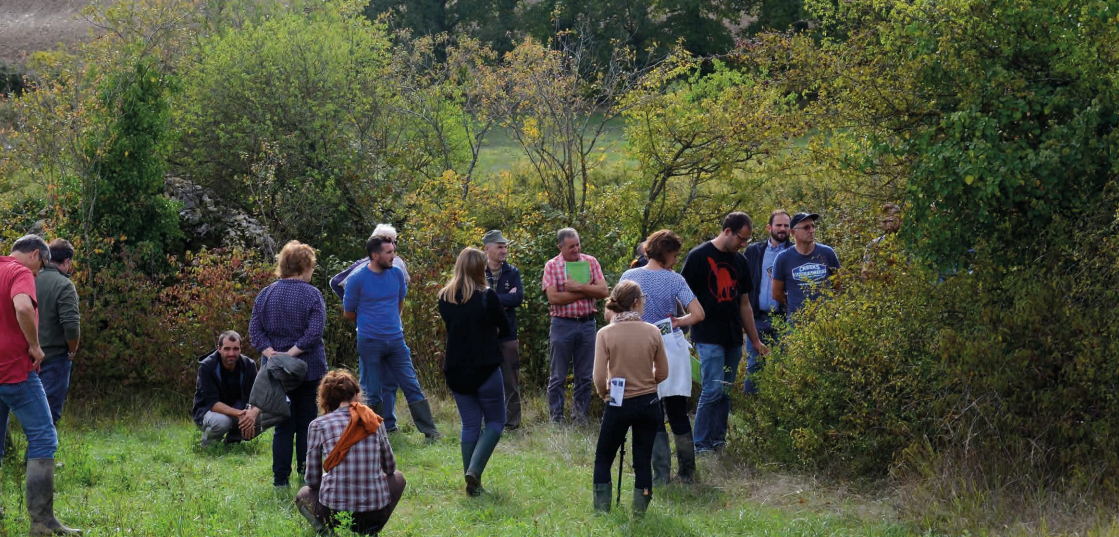
> Visite de ferme pilote dans le cadre du programme CORRIBIOR

« CORRIBIOR », « Messiflore » et le programme de « Conseils et accompagnement pour la mise en oeuvre de mesures en faveur de la biodiversité » sont trois programmes distincts, partageant une stratégie commune mise en oeuvre pour développer des modes de gestion favorables à la préservation ou à la restauration de la sous-trame milieux ouverts de la Trame Verte et Bleue et pour accompagner les acteurs du territoire.