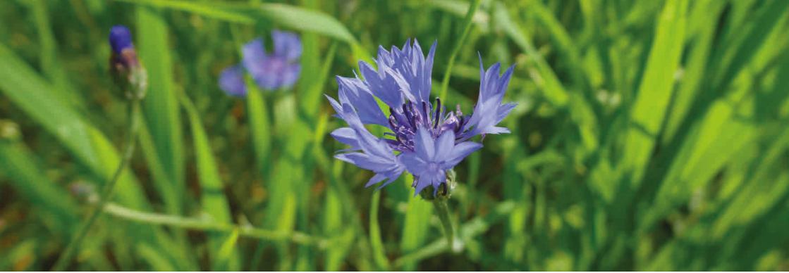
> Bleuet des champs ( Centaurea cyanus ) plante messicoles, très attractive pour les pollinisateurs.

La Fédération régionale des chasseurs d'Occitanie (FRCO), l'Association française pour l'Arbre et la Haie champêtre d'Occitanie (AFAHC Oc), Le Conservatoire botanique national des Pyrénées et de Midi-Pyrénées (CBNPMP), la Ligue pour la protection des oiseaux Aveyron (LPO 12), ont le plaisir de vous inviter à trois demi-journées de restitution de leurs programmes menés dans le cadre de la Trame Verte et Bleue, les :