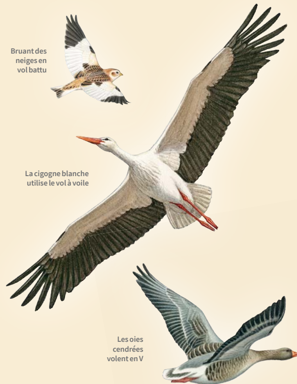
Bruant des neiges en vol battu

Le vol en V des migrateurs grégaires permet aux oiseaux, situés derrière l'oiseau qu'il succède, de profiter de l'aspiration de ce dernier et donc d'économiser de l'énergie.