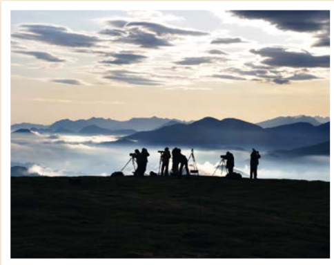
Suivi au col d'Organbidexka Clive Lachlan

L'observation directe, au niveau de points de concentration (détroits, cols de montagne, estuaires et caps marins, lacs, etc.) est la plus répandue, et permet de dénombrer les migrateurs.