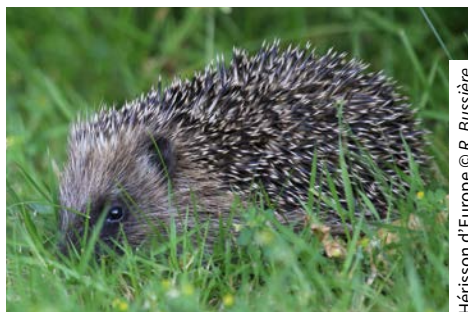
Hérisson d'Europe

■ Assurer la transparence des ouvrages hydrauliques pour la faune des rivières.