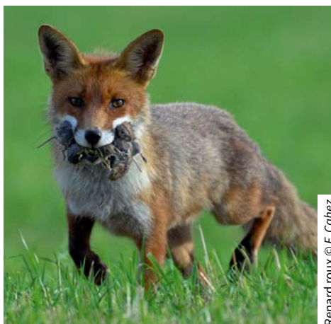
Renard roux

■ Proscrire toute activité portant atteinte à la condition animale : chasse à courre et chasse traditionnelle (type vénerie sous terre) sur les propriétés communales, cirques avec animaux sauvages etc.