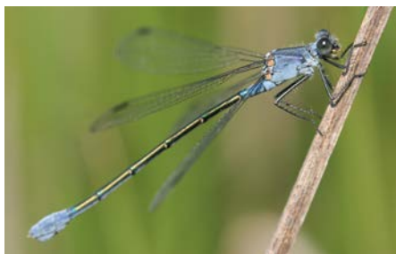
Leste à grands stigmas

■ Accompagner les exploitants agricoles vers une agriculture respectueuse de l'environnement à travers des aides et par la commande publique : transition vers toutes les formes d'agro-écologie, implantation de nouvelles exploitations, aménagements pour favoriser le retour de la faune sauvage dans les exploitations en tant qu'auxiliaire de culture.