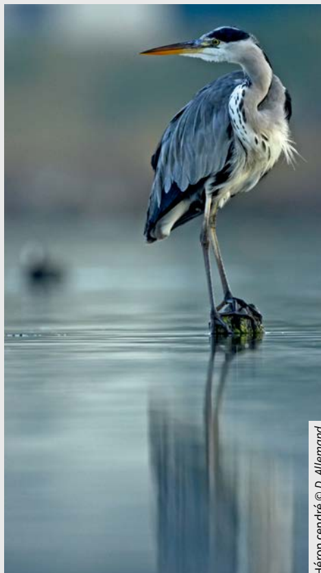
Héron cendré

En savoir plus : https://ceser.bretagne.bzh