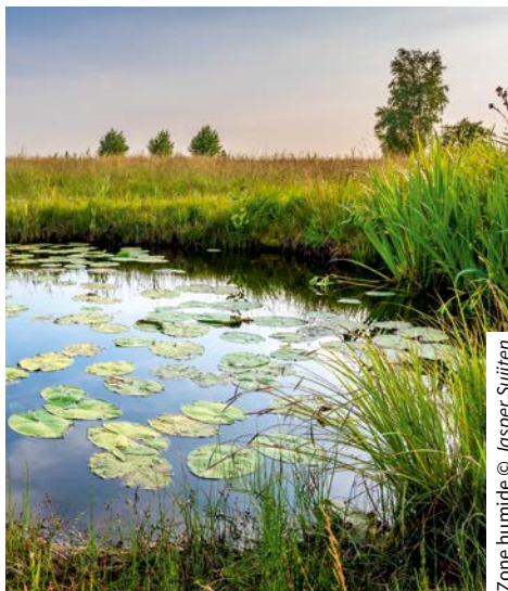
Zone humide

■ Mettre en œuvre efficacement la séquence Eviter-Réduire-Compenser pour chaque projet d'aménagement en donnant priorité à l'évitement.