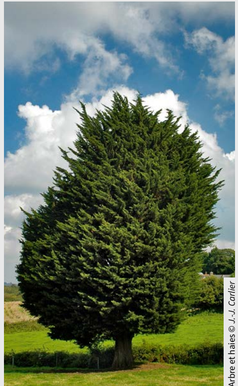
Arbre et haies

En savoir plus : www.capitale-biodiversite.fr