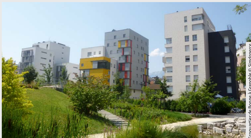
Ecoquartier de Bonne à Grenoble

En savoir plus : http://mead-mouans-sartoux.fr/la-regie-agricole/