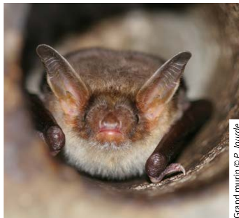
Grand murin

Certains animaux dits « anthropophiles » nichent ou gîtent dans des constructions, comme les hirondelles rustiques et de fenêtre, les martinets, les effraies des clochers et les chauves-souris. Ces espèces sont en net déclin, en partie à cause de la raréfaction de leurs habitats (grillage anti-pigeons, fermeture des étables etc.). Préserver les constructions anciennes et promouvoir une architecture propice à l'installation des espèces du bâti permet de revitaliser les villes et villages en biodiversité.