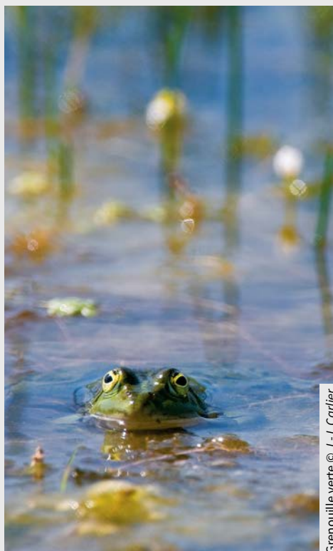
Grenouille verte © J.-J. Carlier

Trame blanche. La ville de Bruxelles a créé une cartographie de l'aire urbaine sur le critère du niveau sonore et elle y a intégré des « Quiet-zone » correspondant à des zones calmes ou zones de confort acoustique en espace public ou dans des quartiers dans lesquels le niveau sonore est plafonné à 55 dB.