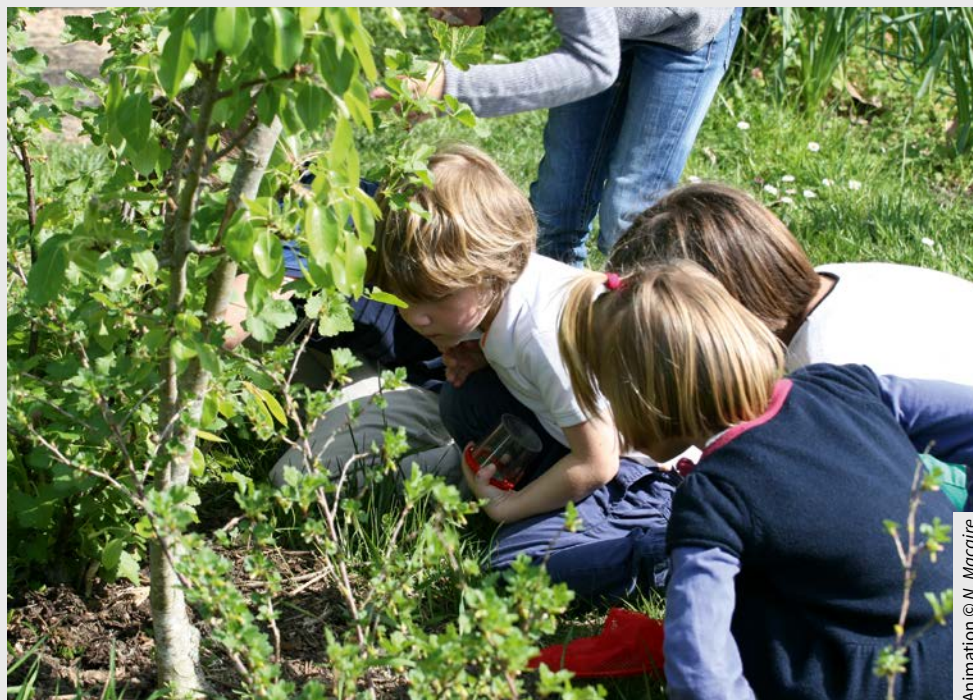
Animation © N. Macaire

En savoir plus : www.vigienature-ecole.fr