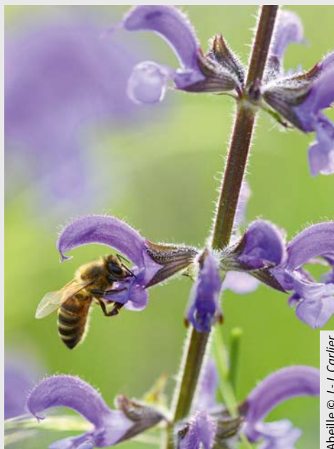
Abelle © J.-J. Carlier