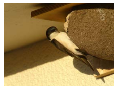
Hirondelle de fenêtre sur nichoir artificiel

La Boutique LPO propose à la vente des planchettes en bois et des nichoirs artificiels destinés à cet usage, que l'on peut retrouver sur : https://boutique.lpo.fr