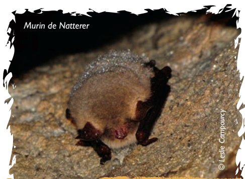
Murin de Natterer