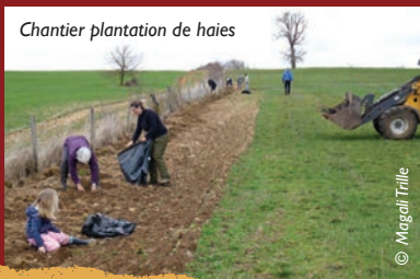
Chantier plantation de haies