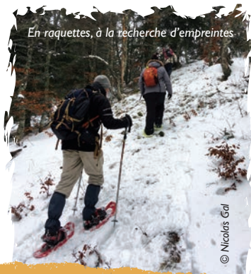
En raquettes, à la recherche d'empreintes