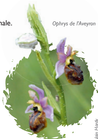
Ophrys de l'Aveyron