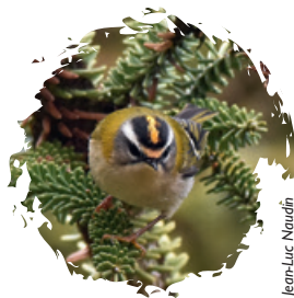
Roitelet à triple bandeau

Si vous souhaitez donner un peu de votre temps, n'hésitez pas à REJOINDRE LA LPO