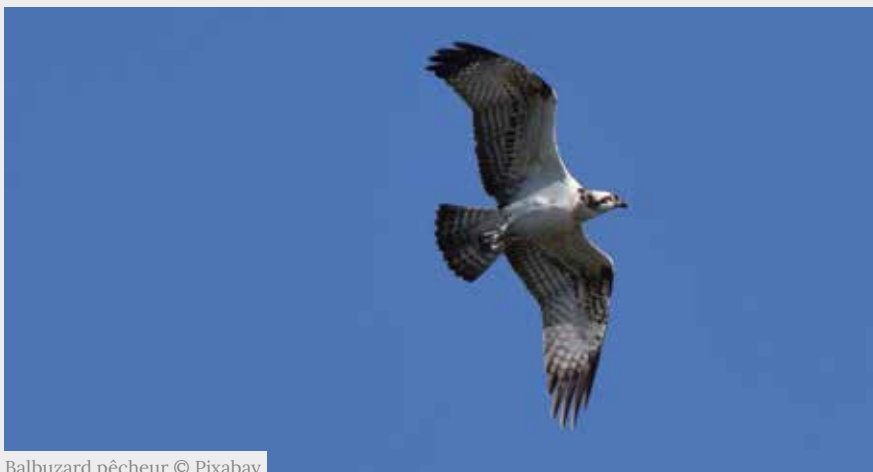
Balbuzard pêcheur

Le Balbuzard pêcheur est un rapace migrateur qui se nourrit de poissons. Il se reproduit de mars à août et niche dans les arbres à proximité des cours d'eau. Les activités humaines représentent une menace majeure pour l'espèce.