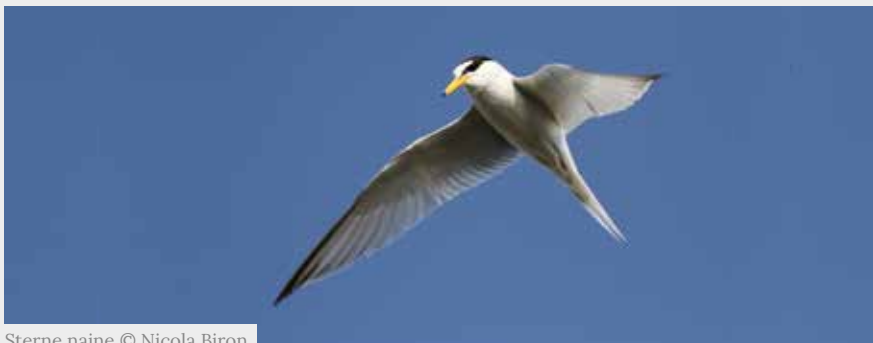
Sterne naine

Les sternes sont des oiseaux qui nichent au sol, sur les rives des cours d'eau. Au printemps, leurs sites de reproduction font l'objet d'une attention particulière pour éviter les piétinements des nids.