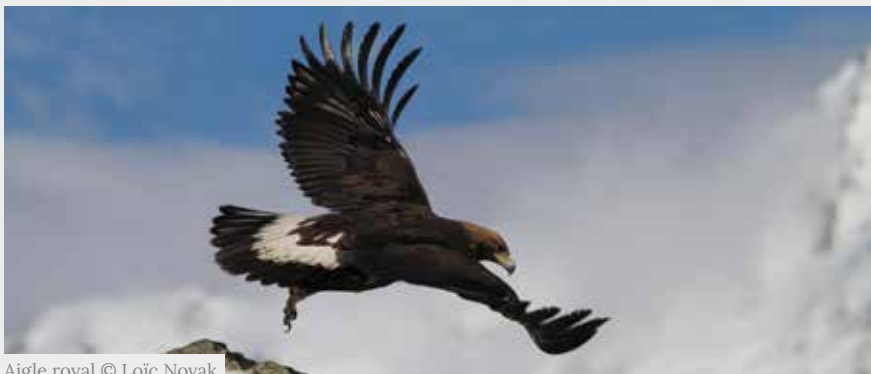
Aigle royal

L'Aigle royal est un grand rapace qui se reproduit de janvier à août et niche dans les arbres et en falaise. Le dérangement peut compromettre les chances de succès d'envol des jeunes (1 ou 2 par an).