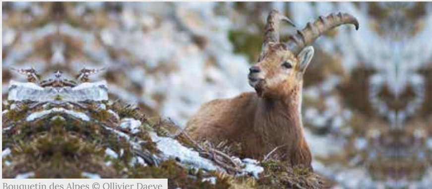
Bouquetin des Alpes

À l'aise en falaise, le Bouquetin est moins adapté aux attaques venant du ciel. En effet, un prédateur aérien peut déclencher un mouvement de fuite de la harde. Dans la précipitation, des jeunes peuvent tomber ou être bousculés.