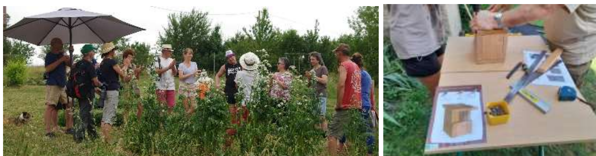
Ateliers sur le thème de la biodiversité de proximité

16 rencontres saisonnières des Refuges LPO ont été organisées auprès de 378 personnes dans 5 départements. Deux jardins ont également ouvert leurs portes à l'occasion de la Fête de la Nature