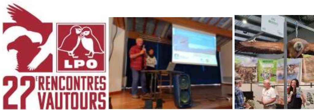
Rencontres vautours dans l'Aude et stand de présentation des PNA vautours au salon Ad Natura