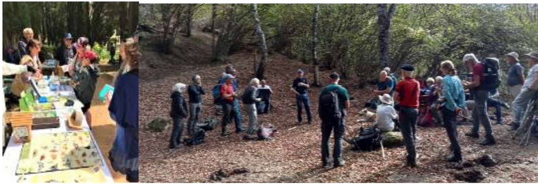
Bénévoles des groupes locaux et thématiques