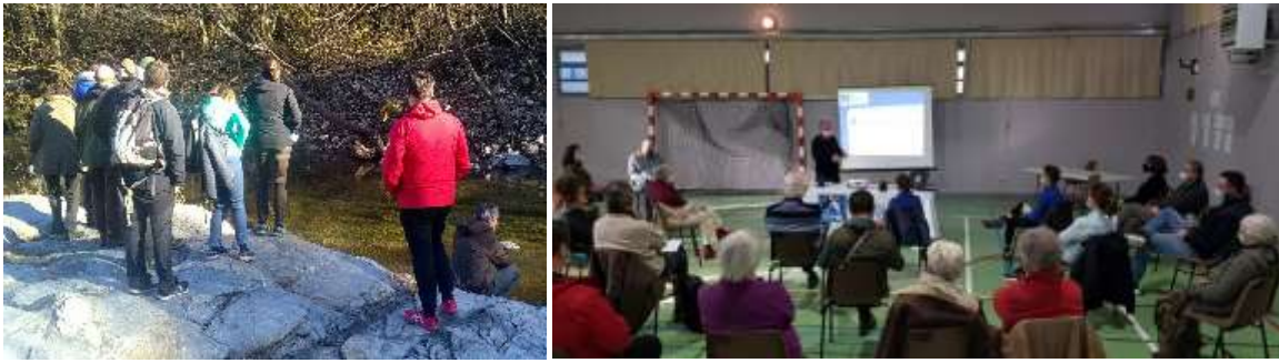
Première rencontre des bénévoles et adhérent-es gardois-es

Un nouvel outil à destination de nos adhérent-es et bénévoles a pris petit à petit sa place dans notre fonctionnement : https://monespace.lpo.fr Il permet sur une seule plateforme de s'inscrire aux missions de bénévolat et consigner les heures réalisées, gérer son adhésion à l'association, créer un Refuge LPO ou encore acheter à la boutique LPO.