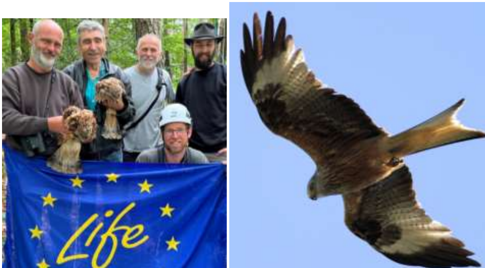
En 2022 8 jeunes Milans royaux ont été équipés de balises GPS

Des comptages des dortoirs pour les individus hivernants ont été réalisés en janvier lors du comptage national en région Occitanie (Aude, Aveyron, Haute-Garonne, Lot).