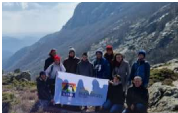
Quelques un-e des salarié-es en séminaire d'équipe sur le Caroux (34)

Nos salarié-es ont bénéficié de 9 formations en 2023 avec des fonds Uniformation (Opérateur de Compétences agréé par l'État chargé d'accompagner la formation professionnelle).