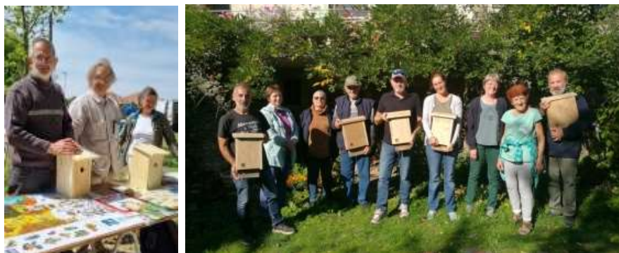
Rencontres de propriétaires de Refuges LPO

Au 31/12/2022 la LPO comptait en région Occitanie 3738 Refuges LPO chez des particuliers (dont 101 balcons). Ce sont 456 Refuges LPO particuliers qui ont été créés en 2022