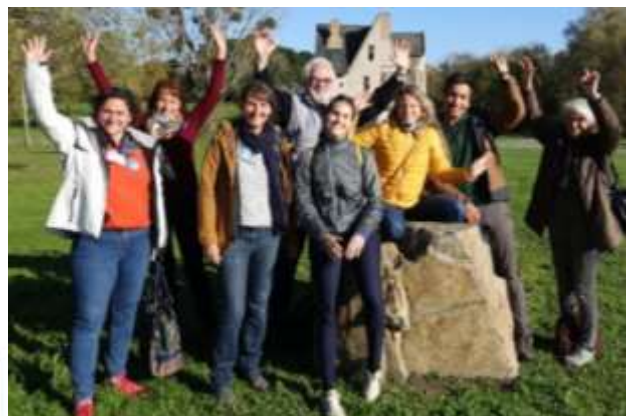
Coordinateurices départementaux du programme Refuges LPO en région Occitanie