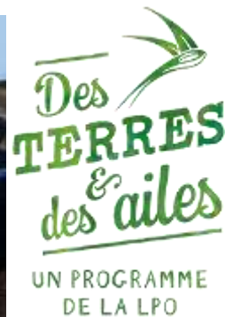
Chantier de plantation de haies chez un agriculteur labellisé « Des Terres et des Ailes »

En 2022, 25 agricultrices et agriculteurs se sont inscrits sur notre site www.desterresetdesailes.fr (163 au total).