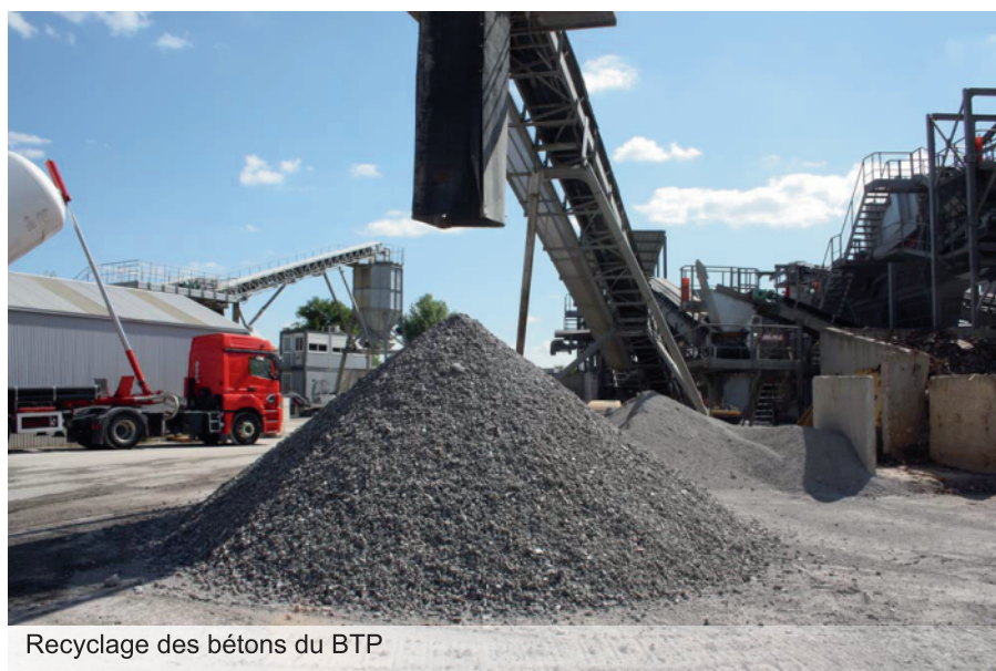
Recyclage des bétons du BTP

production respectueux de l'environnement afin d'éviter l'usage d'intrants (engrais, pesticides) dommageables à la faune et à la flore.