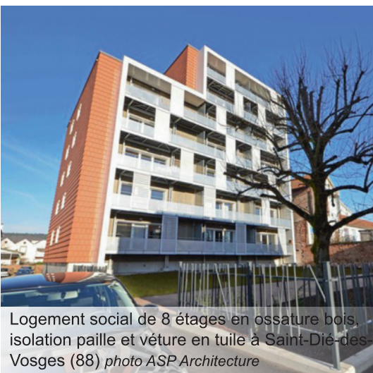
Logement social de 8 étages en ossature bois, isolation paille et vêtue en tuile à Saint-Dié-des-Vosges (88) photo ASP Architecture