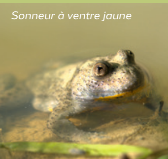
Sonneur à ventre jaune