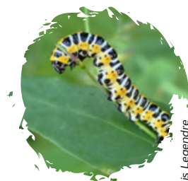
Cucullie de la Laitue

Si vous souhaitez donner un peu de votre temps, n'hésitez pas à REJOINDRE LA LPO