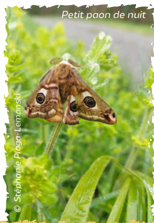
Petit paon de nuit