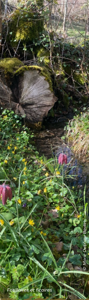
Fritillaires et ficaires

LPO - Service engagement associatif CS 90263 - 17305 ROCHEFORT CEDEX