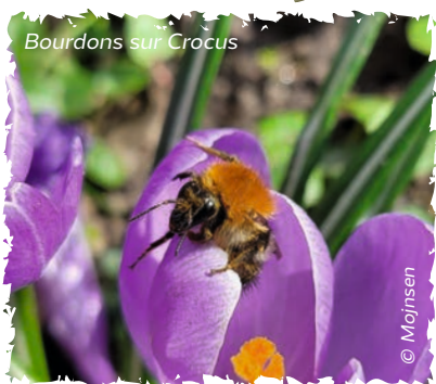
Bourdons sur Crocus

> Camille Schellenberger ☎ 06 01 75 40 05